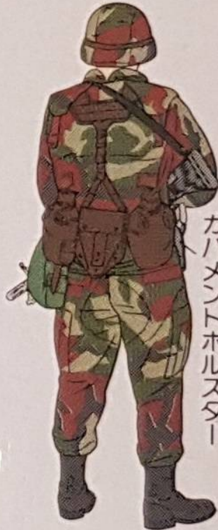
ガバメントホルスター