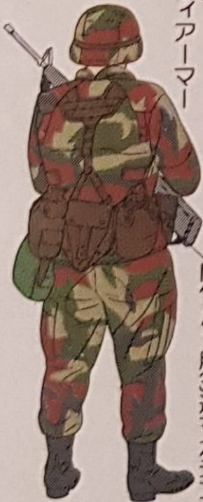
M16A1用30連マガジンハウチ